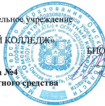
Схема учебного маршрута №4 практического вождения транспортного средства категории «С»